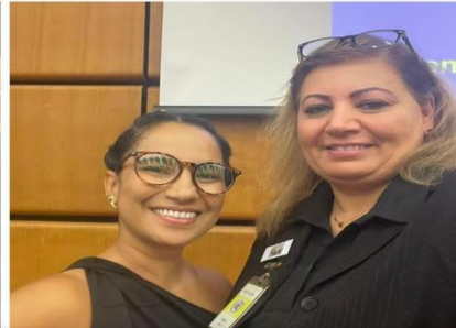
کنفرانس راه بیرون رفت افغانستان از بحران مادرید اسپانیا ۲۰۱۹