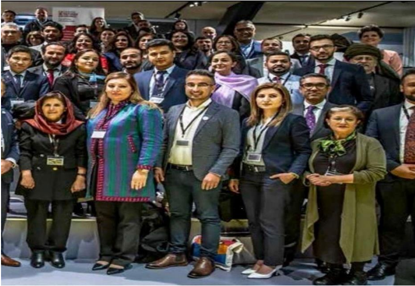
تجلیل از هشتم مارچ افغانستان ۲۰۲۰